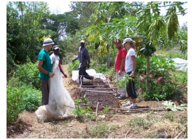
Camp de Treball – Missió a Masonga (Tanzània), estiu de 2006

En aquest apartat pot ser bo comptar amb la presència d'alguna persona jove que hagi participat recentment d'aquesta campanya i que pugui explicar la seva experiència personal al llarg del procés de formació previ i de l'estada al país del Sud.