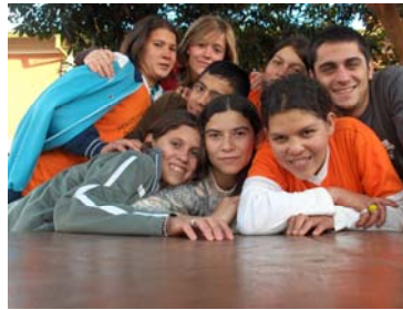
Camp de Treball – Missió a Caaguazú (Paraguai), estiu de 2006