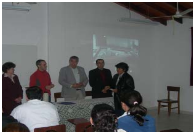
Dijous 2 d'agost a Villarrica, Paraguai. Lliurament del Premi de Solidaritat SED 2007.