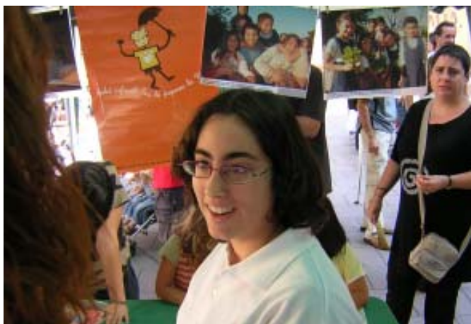
Diumenge 8 d'octubre, diverses activitats informatives i de sensibilització a l'estand de SED a la Festa de la interculturalitat del Districte de Les Corts de Barcelona.