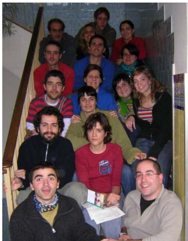
Diversos moments del cap de setmana de formació del 17 i 18 de febrer a la casa Marista de Llinars del Vallès.