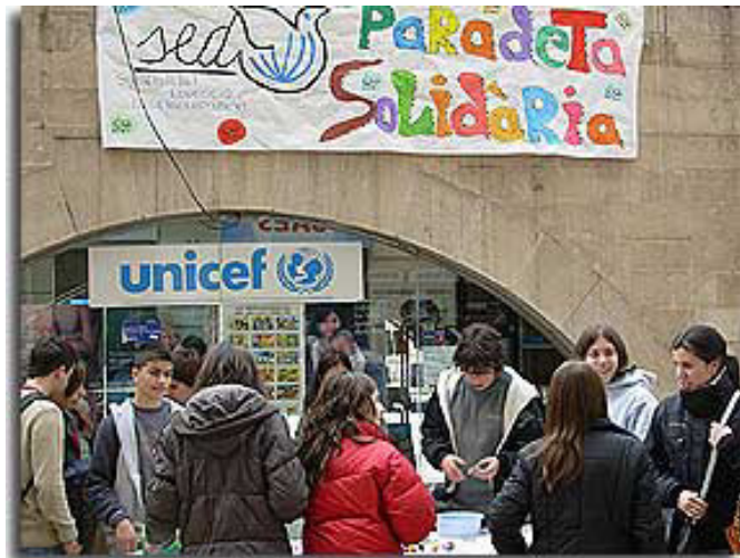
Dissabte 18 de març el grup d'AJMACOR de Lleida instal·là una paradeta solidària a la plaça Sant Joan per donar suport al projecte escolar d'enguany