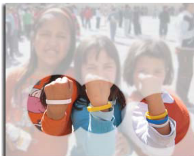
Polseretes solidàries a l'escola Maristes Sants - Les Corts, durant la setmana de la Solidaritat, del 20 al 24 de març