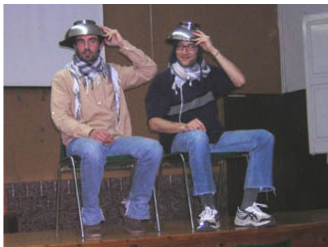
Cap de setmana 18 i 19 de febrer a la casa de Llinars del Vallès. Dos moments lúdics de la primera trobada formativa de la campanya d'introducció a la solidaritat internacional.