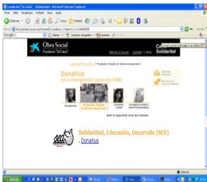
Pàgina web www.lacaixa.es/solidaritat des d'on es poden fer donatius a SED. Cal anar a l'apartat «Donatius - Projectes d'ajuda al desenvolupament»