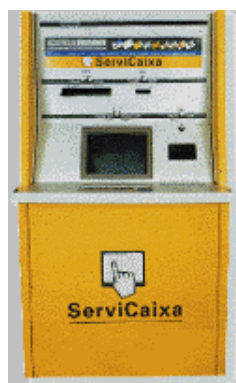
Terminals ServiCaixa de La Caixa, des d'on es poden fer donatius a SED. Cal anar a l'apartat «Donatius»