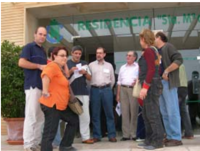
Alguns dels participants de la Província L'Hermitage a la I Trobada de Programes i Presències Socials Maristes d'Europa. Guardamar, 29, 30 i 31 d'octubre.