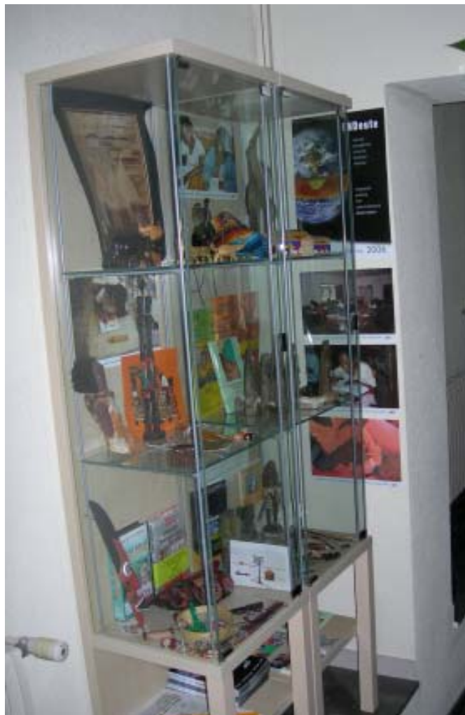
Nou punt d'informació, mostra de materials educatius propis i d'artesanania del Paraguai i de Tanzània situat a la planta baixa del Casal d'Entitats Maristes de Barcelona, en els espais compartits amb la Pastoral i els altres moviments vinculats.