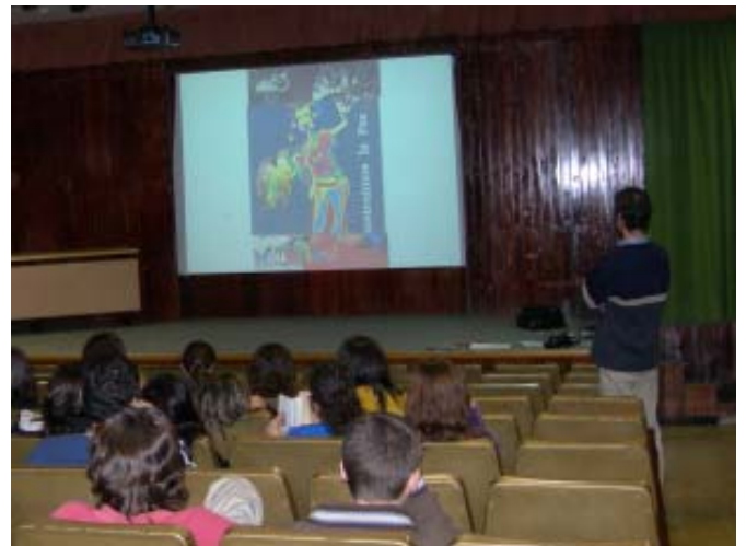
Presentació de la campanya ENDeute de SED als alumnes de batxillerat de Maristes Sants-Les Corts, a l'auditori de l'escola, dilluns 21 de novembre.