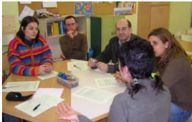
Un dels grups de Compartir a la trobada d'obres socials maristes a Santa Coloma de Gramenet, 12/02/05.