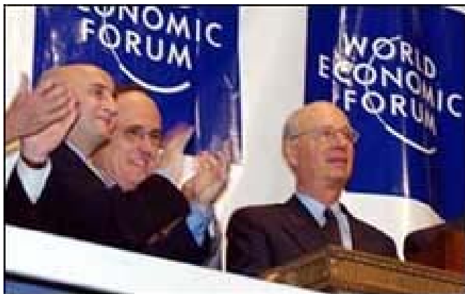
Klaus Schwab, fundador del Fòrum Econòmic Mundial, i altres participants a l'acte de cloenda, 31/01/2005.