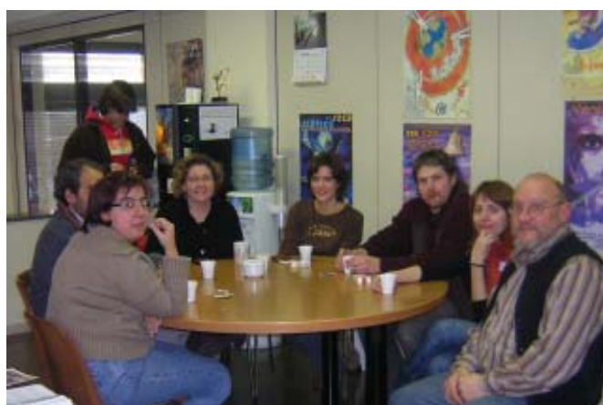
Alguns membres del grup de voluntariat SED-Catalunya prenent un cafè en un moment de descans.