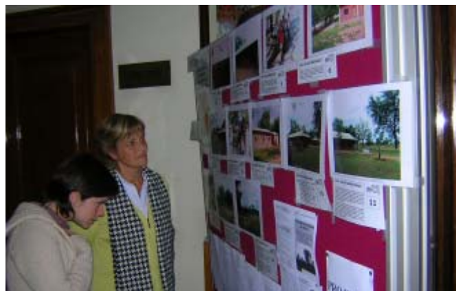
Panell informatiu del projecte del curs 2003-2004 a la recepció de l'escola Maristes Sants-Les Corts.