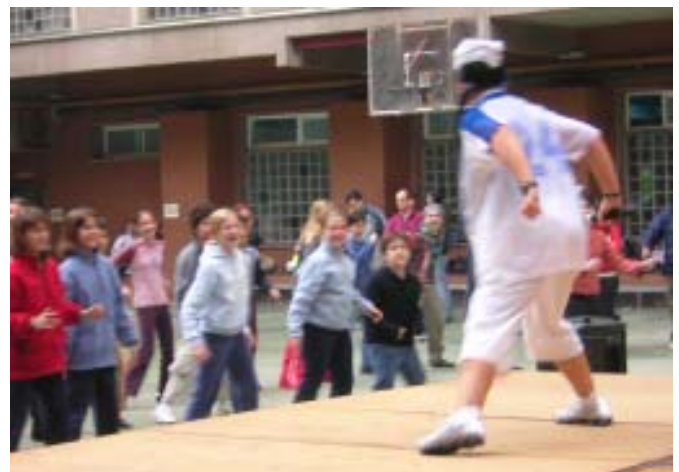
Dissabte 20 de novembre al matí, alumnes de secundària fent aeròbic a ritme de música al pati de l'escola Maristes Sants-Les Corts, dins el Triatló Solidari per donar suport al projecte de Mitanguera d'Horqueta.