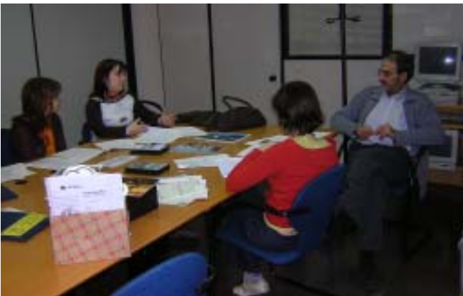
Dissabte 20 de novembre al matí, sessió de treball del SED-Casal amb alguns voluntaris i voluntàries.