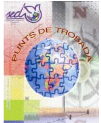
Pòster campanya SED

Altres materials complementaris, com els calendaris de sobretaula, els calendaris adhesius, pins, etc, estaran llestos properament per fer arribar a socis, col·laboradors, grups locals de voluntariat, escoles i altres.