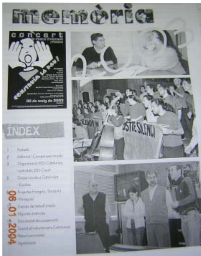
Portada de la memòria d'activitats del 2003 de la delegació de Catalunya.