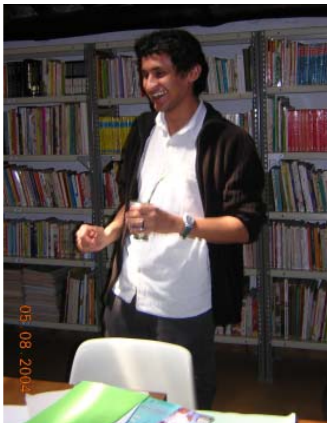
En Samuel fent classes de guaraní i introducció al Paraguai en la darrera trobada formativa.