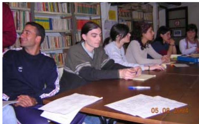
Cap de setmana de Formació a la casa Ca N'Oriol de Rubí.