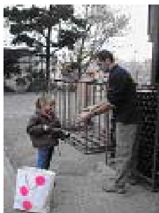
Campanya del Cava a Girona, 2 de gener de 2004