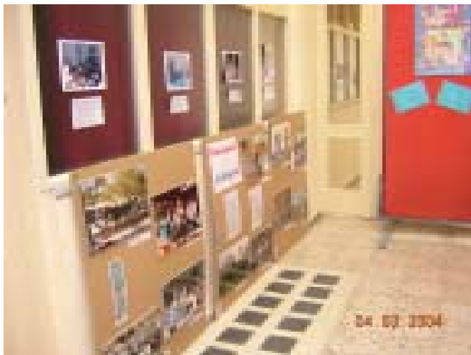
Exposició El Paraguai i l'alegria a Lleida Montserrat