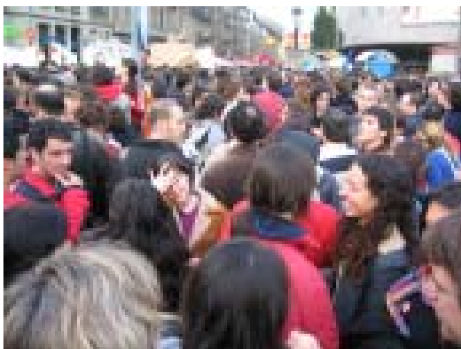
Manifestació No Oblidem! 20 de març de 2004