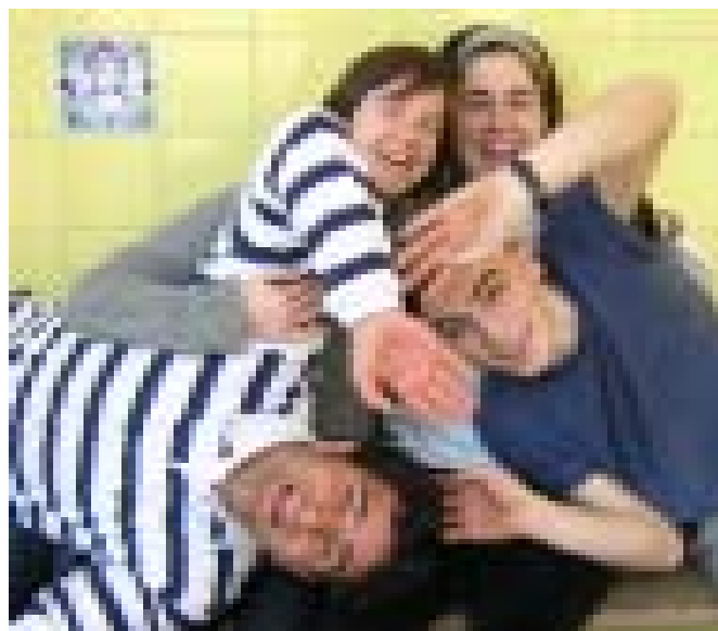
El grup de CTM d'Horqueta, Paraguai 2004