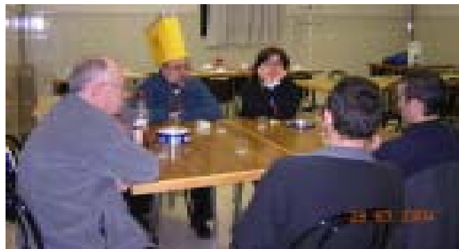
Trobada del grup SED-Casal a Llinars