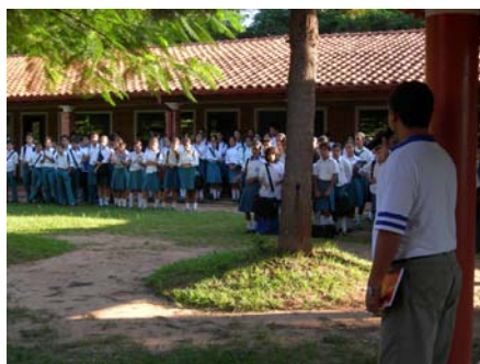
Col·legi Champagnat de la ciutat de Coronel Oviedo