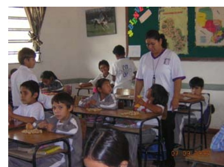
Centre Parroquial Santa María del Chaco , de la ciutat de Mariscal Estigarribia

Per què 175 beques en aquesta campanya? Aquest total de 175 infants i joves representen gairebé un 2% de l'alumnat dels 6 centres del Paraguai amb els quals col·laborem. Valorem aquesta aportació anual com suficient per a assegurar l'objectiu de l'educació d'aquests infants i joves, però que tampoc no crea vincles exagerats de dependència, que no serien bons. Aquests 175 infants i joves provenen de famílies amb recursos molt limitats per la qual cosa, si no fos per aquesta ajuda econòmica a l'estudi, es veurien obligats a deixar els seus estudis i posar-se a treballar per a ajudar a l'economia familiar.