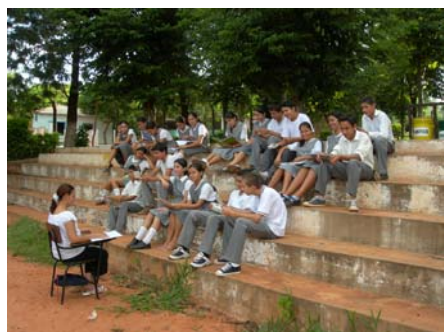
Escola Marcelino Champagnat del barri Empalado Ari, de la ciutat de Caaguazú

de rendes baixes o molt baixes, amb dificultats per satisfer les necessitats bàsiques d'alimentació, salut i educació.