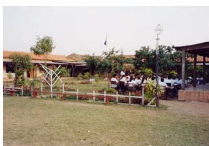
Col·legi Sagrada Família , de la ciutat de Limpio