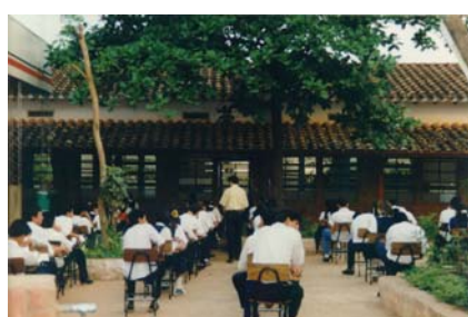
Col·legi Alejo García , de la ciutat d'Horqueta