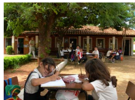
Escola La Inmaculada , de la ciutat d'Horqueta