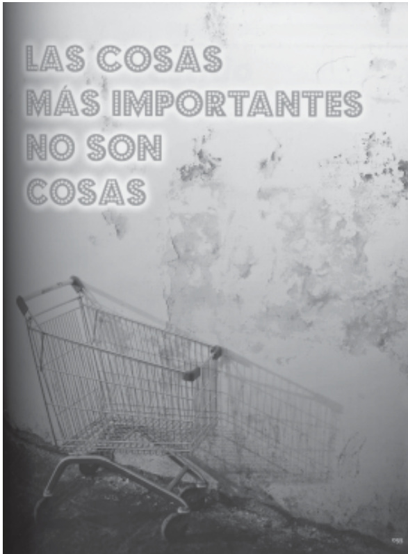
Siro LÓPEZ, Contenedor de silencios , Ed. KHAF-Edelvives, Saragossa, 2009.